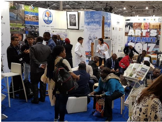
Pavillon ENERGIES 2050 Zone Pays – COP23 (Bonn, Novembre 2017)