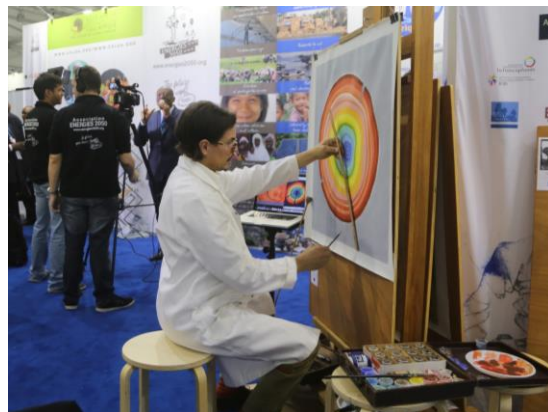
ART's PLANET by ENERGIES 2050 (Edition 2017) Performance artistique sur le Pavillon ENERGIES 2050