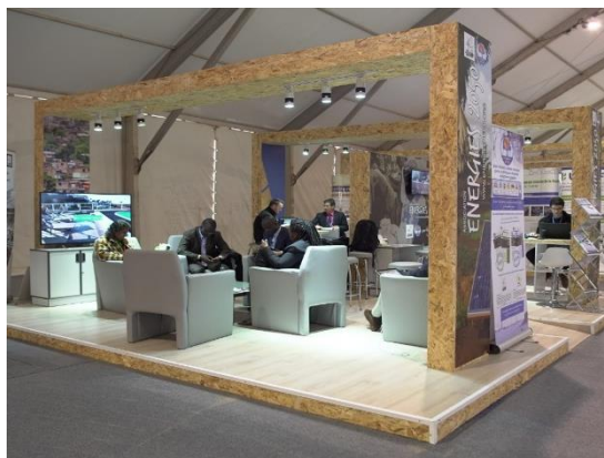
Pavillon ENERGIES 2050 Zone Verte – COP22 (Marrakech, Novembre 2016)