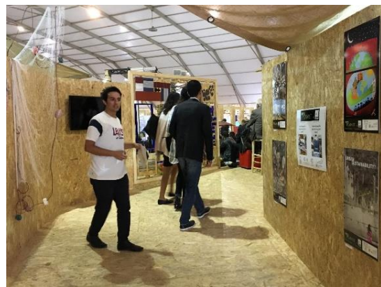
ART's PLANET by ENERGIES 2050 (Edition 2016) Exposition sur l'Espace Jeunesse de la Coopération Suisse