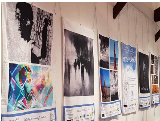
ART's PLANET by ENERGIES 2050 (Edition 2017) Exposition pour le festival des solidarités