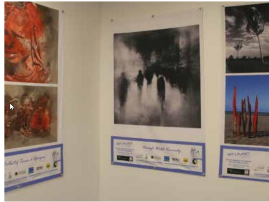
ART's PLANET by ENERGIES 2050 (Edition 2017) Exposition sur le Pavillon de la Francophonie